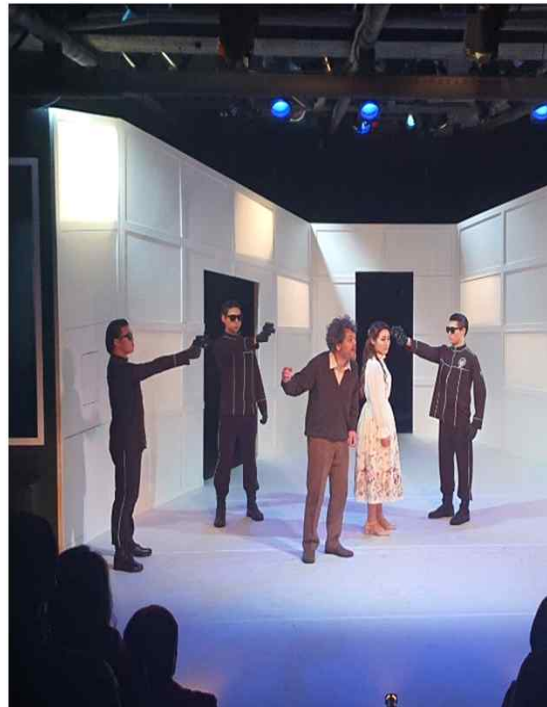
① 목표 및 성과 - 한국과학창